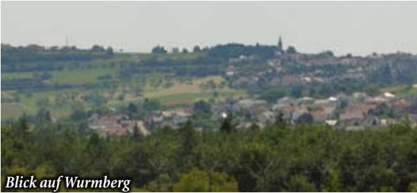
Blick auf Wurmberg

Die Wanderung führt über die Grenzen Pforzheims hinaus in die Nachbarorte Neubärental - Wurmberg. Abwechslungsreiche Route: Hochwald, Neubepflanzungen, Wiesentäler, Aussichtspunkte, Kulturdenkmale.